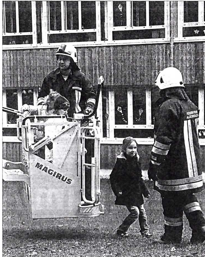
Über die Drehleiter wurden Kinder aus dem Obergeschoss sicher aus dem Gebäude gebracht.

Entsprechend groß war die Aufregung bei den Kindern, aber auch bei den Lehrern. Fasziniert beobachteten sie die Drehleiter, die auf 16 Meter ausgefahren wurde und zügig immer zwei bis drei Kinder nach unten transportierte. Ein Stockwerk weiter unten durften die Mädchen und Buben aus dem Fenster klettern und wurden von den Wehrmännern über die Brüstung gehoben. „Ein Dirndl hat geweint und über Bauchweh geklagt